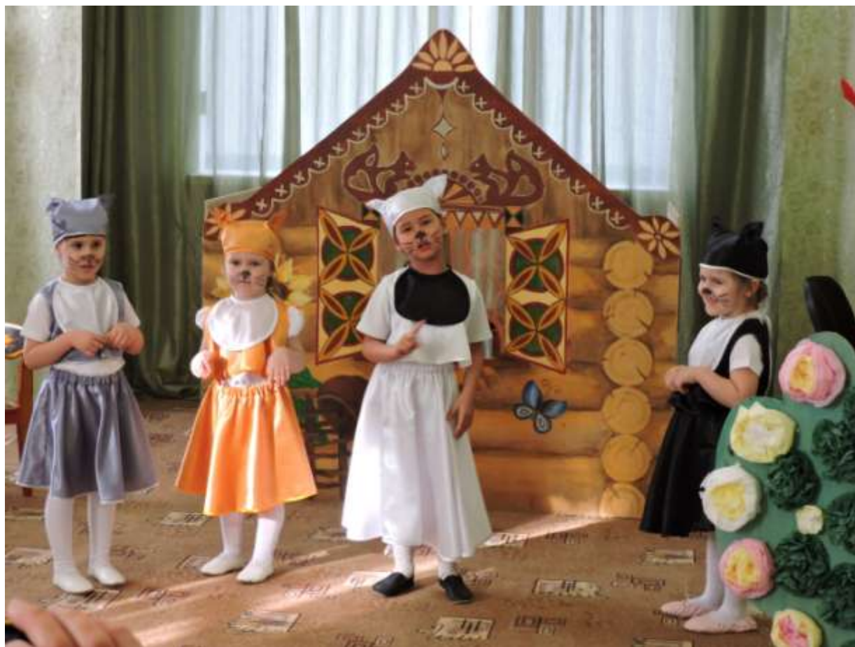
Инсценировка «Перчатки для котят»